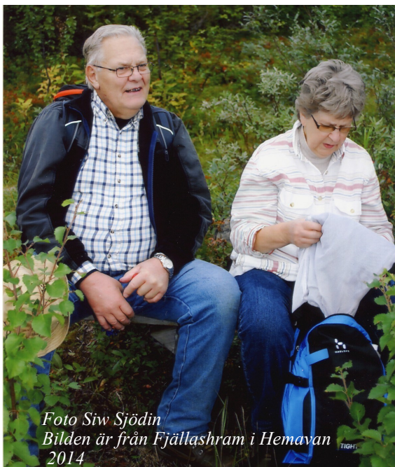
Bilden är från Fjällashram i Hemavan 2014